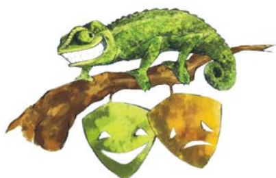
TEATRO EL LUGÁ